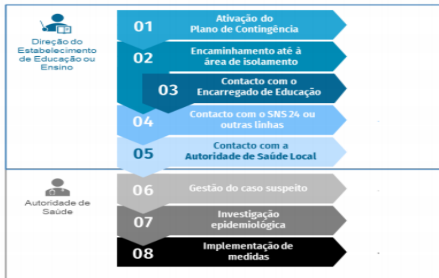
Fluxograma de atuação perante um caso suspeito de COVID-19 em contexto escolar, in Referencial Escolas- Controlo da Transmissão de Covid-19 em Contexto Escolar

Perante a identificação de um caso suspeito, serão adotados os seguintes procedimentos