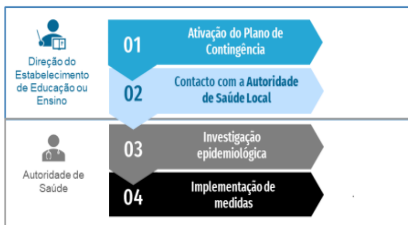
Fluxograma de atuação perante um caso confirmado de COVID-19 em contexto escolar, in Referencial Escolas - Controlo da Transmissão de Covid-19 em Contexto Escolar